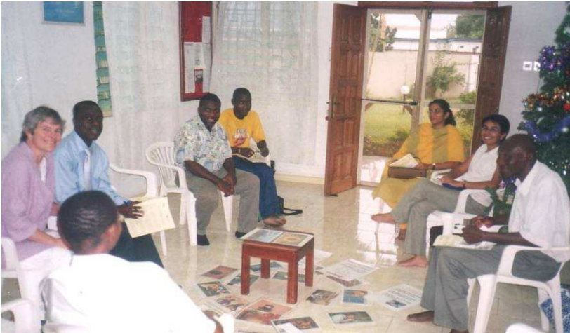
Atelier Living Values, avec le bureau local, Accra, Ghana