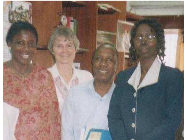
Rencontre avec des représentants de la Commission Nationale pour l'UNESCO, Ghana