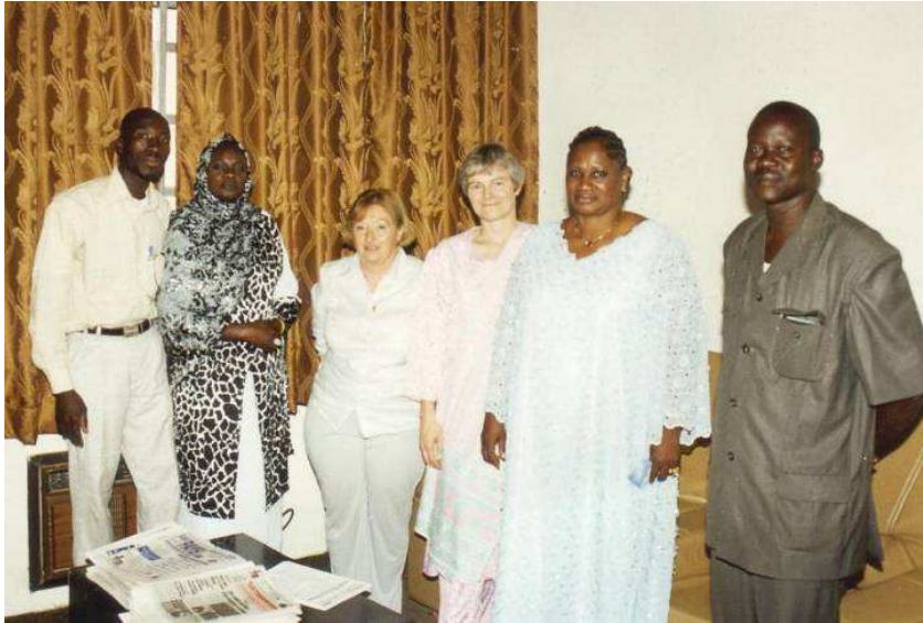
Une délégation de LVE rencontre Madame Mariam Lamizana, Ministre de l'Action Sociale et de la Solidarité Nationale au Burkina Faso. Experte des Droits de la Femme dans son pays, elle souligne l'importance de redonner force et confiance aux jeunes filles, et aux femmes